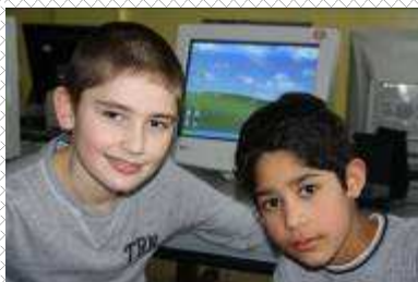
Ciao Tris Mvc - Serena Bim Tesbank