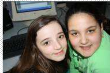
Lia Raro Uao - Vai Rana Mazak Mihon