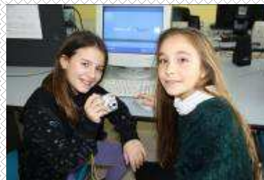
Cavallina Niesenit - Gomma Ei Vi