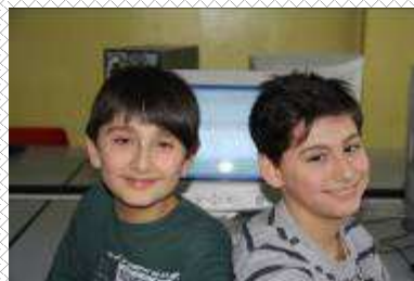
Valm San Chiodo - Totti Asin Magia