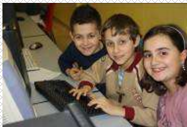
Pugile Ilaton - Luka Passi Lavv Dht Gina Mimcane